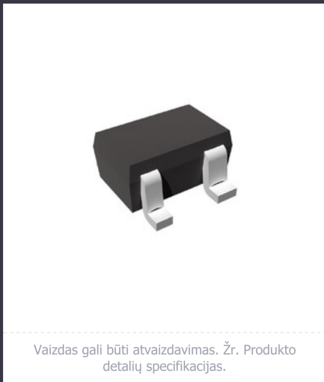
Vaizdas gali būti atvaizdavimas. Žr. Produkto detalių specifikacijas.